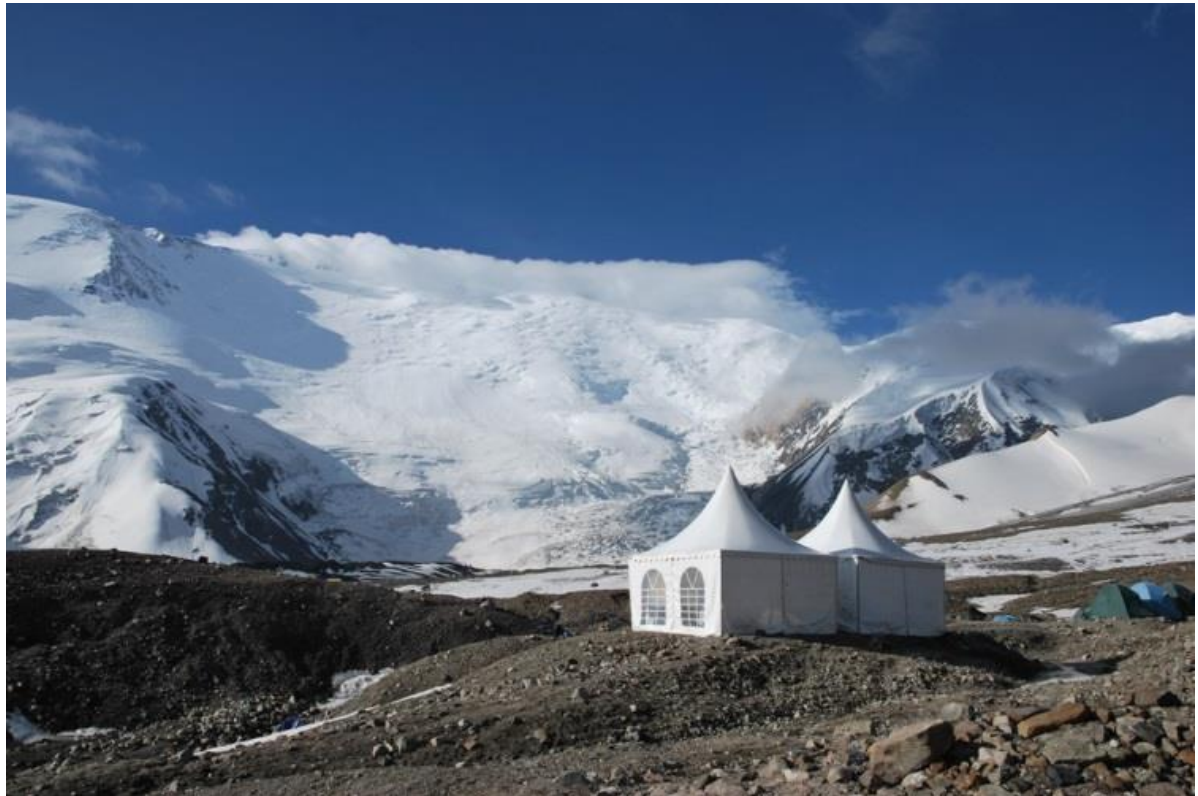
Camp 1 sur le glacier à 4400m